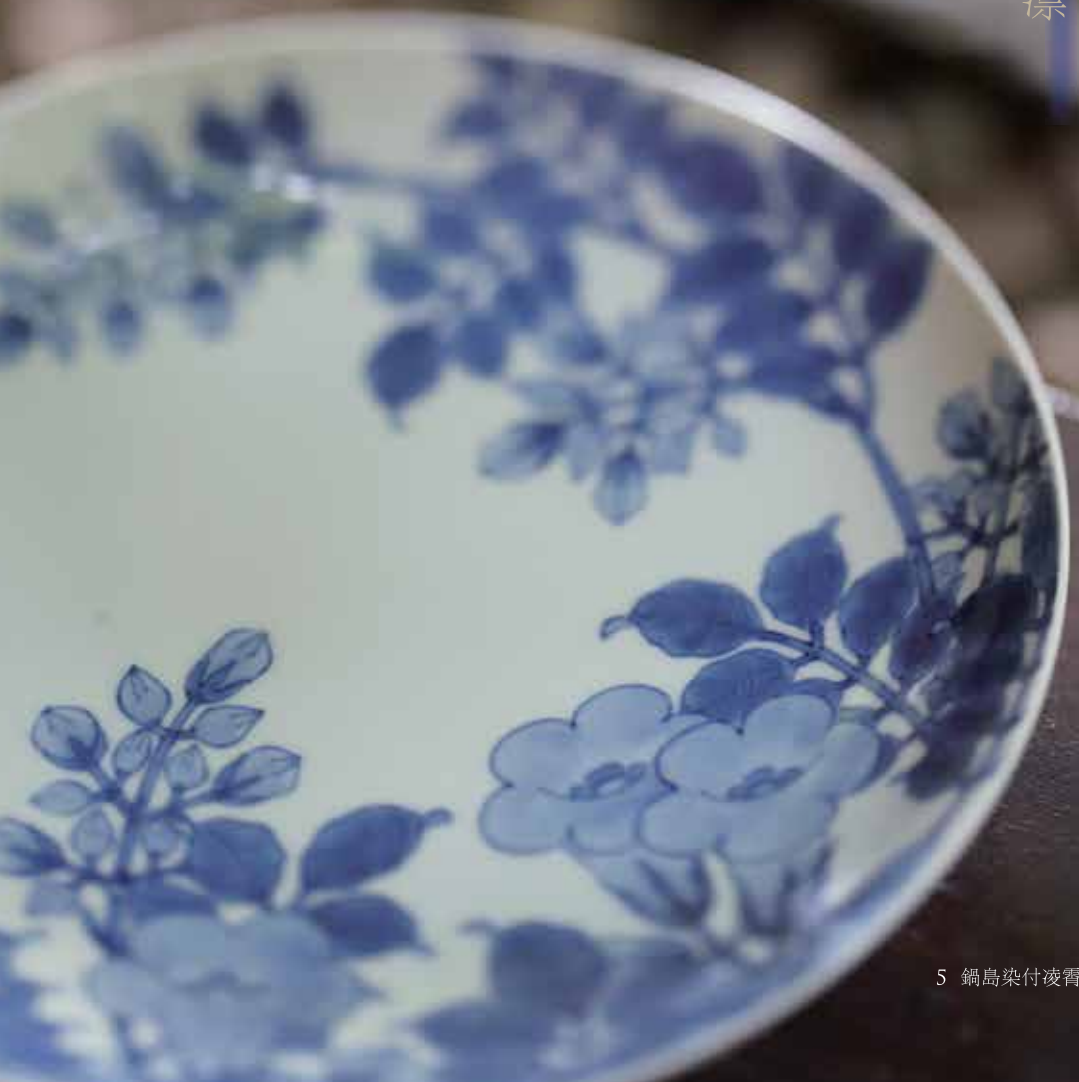
5 鍋島染付凌霄花文皿