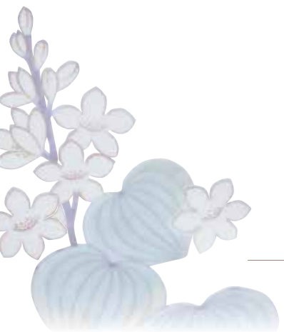
3 鍋島色絵青海波水葵文皿